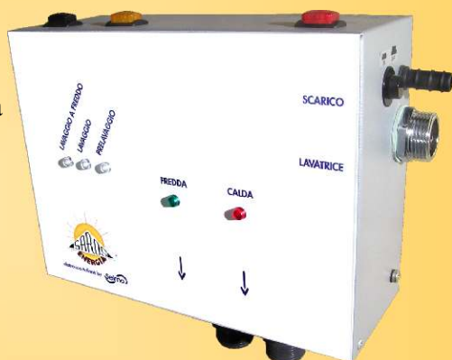
Save El.En., l'unico dispositivo per immissione di acqua calda in lavatrice

Cosa stai aspettando, Save El.En. è facilissimo da installare (istruzioni fai da te incluse), ed è adatto a tutti i modelli di lavatrici.